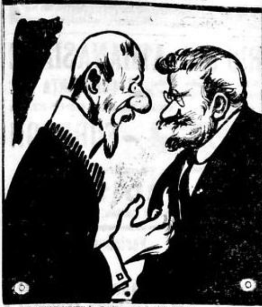
FRATELE VINTILA: Se făcura, hai, și fără noi! TATA AVERESCU: Serbările se făcura, dar ce ne facem noi!